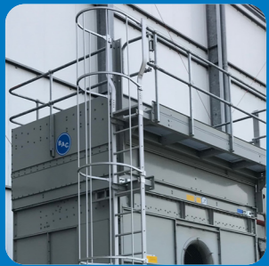
Внешняя платформа с лестницей и перилами