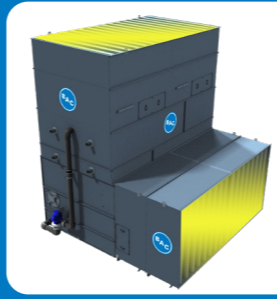
А дополнительные впускные и выпускные экраны