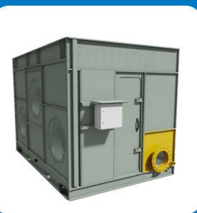
соединение удаленный отстойник