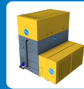
Шумоглушитель на впуске и на выпуске