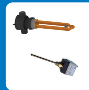
Комплект подогрева поддона