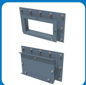
Люк для промывки