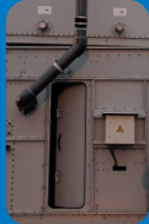
входная дверь противоположная*