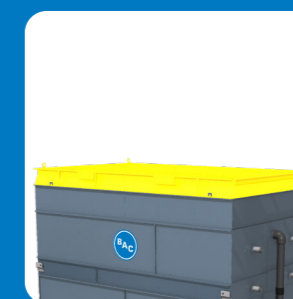
заслонки принудительного закрытия**